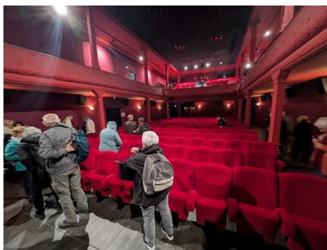
Le cinéma l'EDEN