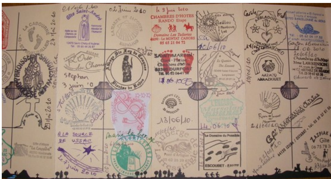
La Créanciale : Quelques tampons de nos soirées étapes.

Lors de notre départ du Puy en Velay nous avons pris notre « créanciale » à la cathédrale. C'est un document de route traditionnel, remis par l'église et signé par l'évêque du lieu de départ, pour recommander le pèlerin à tous les hébergeants qui de fait lui devaient le gîte et le couvert. Les choses ont un peu évolué et le pèlerin règle en général ses hébergements, il fait signer sa créanciale à chaque étape pour apporter à Santiago la preuve de son pèlerinage et recevoir ainsi la Compostella.