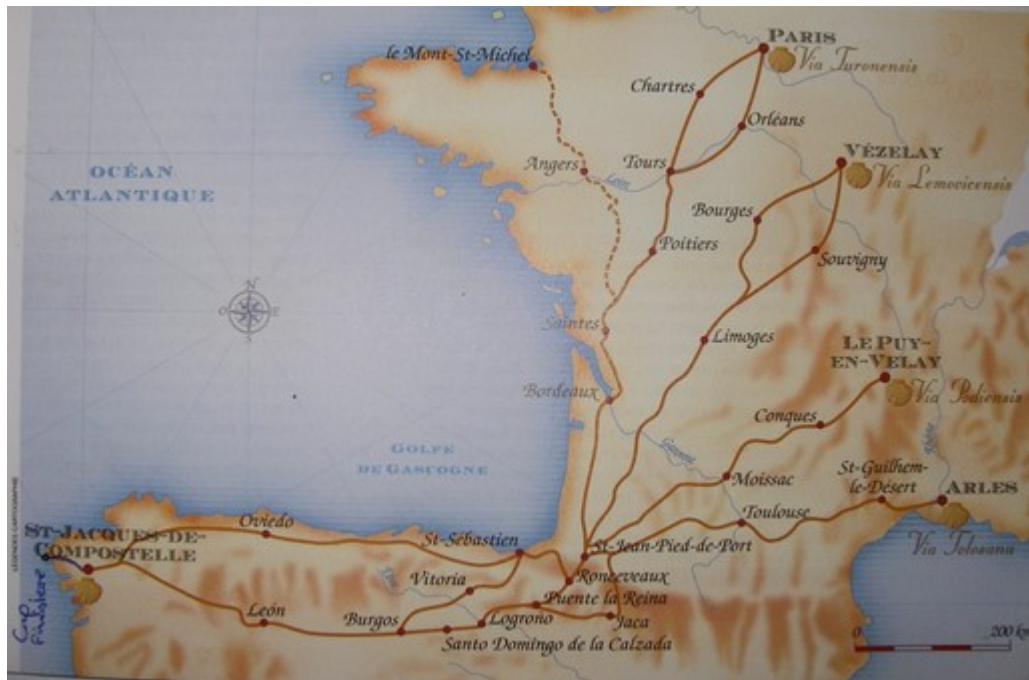
Les quatre voies de France et les deux chemins d'Espagne.

qu'un chemin, qui vient de Jérusalem par mer atteint Brindisi, traverse l'Italie, passe par Turin, arrive en France par le col de Montgenèvre, puis Briançon, Guillestre, Embrun, Gap, Sisteron, Ganagobie, Forcalquier, Céreste, Apt et rejoint le chemin d'Arles par Avignon puis Tarascon.